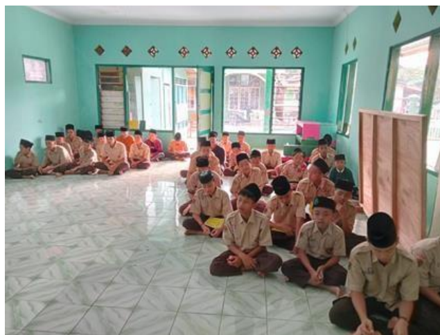
Gambar 2.: Ekstrakurikuler lalaran

Sesuai uraian di atas dapat kita simulkan pembelajaran al-qur'an dengan nilai akhlak untuk siswa dalam bentuk pengetahuan moral di MTs Pesantren El-madani Rawalo yaitu: 1. Siswa terbiasa menjalani aktivitas dengan mematuhi peraturan dan jadwal yang ada serta dilaksanakan dengan hati yang tulus, 2. Siswa terbiasa mengucapkan Dzikir dipagi hari dengan adanya kegiatan mujahadah, 3. Siswa mulai menerapkan akhlak-akhlak baik sesuai apa yang diajarkan dalam Islam apalagi dengan semboyan “jika akhlakmu kotor maka akan sulit hafalannya”, 4. Siswa secara tidak sadar melakukan rutinan dalam menjalankan ibadah sunah seperti puasa senin-kemis, sholat dhuha dan lainnya untuk memperkuat hafalannya. 5. Secara tidak sadar, kegiatan-kegiatan yang sudah diterapkan terhadap siswa memang berbeda dengan anak lain di zaman sekarang ini, mereka melakukan semuanya demi mendapatkan keberkahan sehingga apa yang mereka lakukan lebih mengutamakan akhlak dan adab.