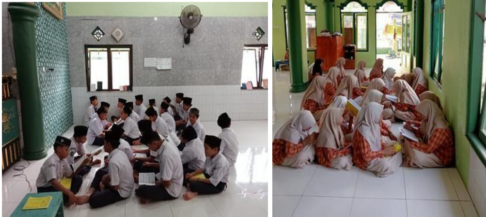
Gambar.1: Rutinan membaca mujahadah, suratan dan Tahfidz