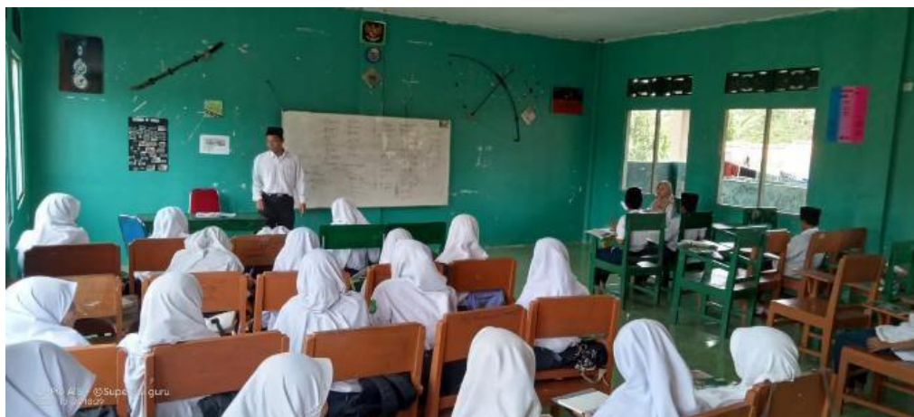
Gambar.3: Kegiatan Tahfiz di Dalam kelas

Sesuai dengan penghayatan moral, dekat sekali kaitannya dengan bagaimana memahami tumbuh kembangnya anak pada fase sekolah menengah pertama yang mudah labil dalam menghadapi perubahan global masa kini (Hasannah, 2020). Maka dari itu, penting sekali didikan terhadap siswa rasa penghayatan sesuai pengetahuan yang didapatkan oleh mereka.