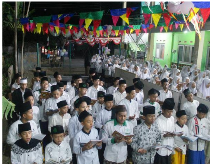
Gambar 5: Sulukan Tafidz Al-Qur'an di luar kelas