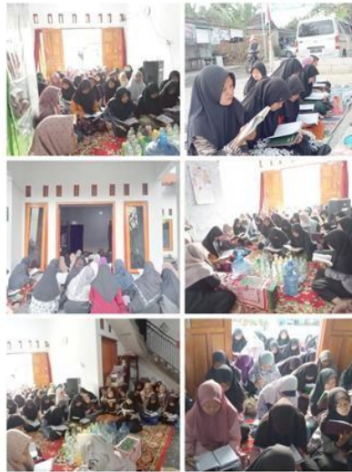
Gambar 4. Kegiatan simaan